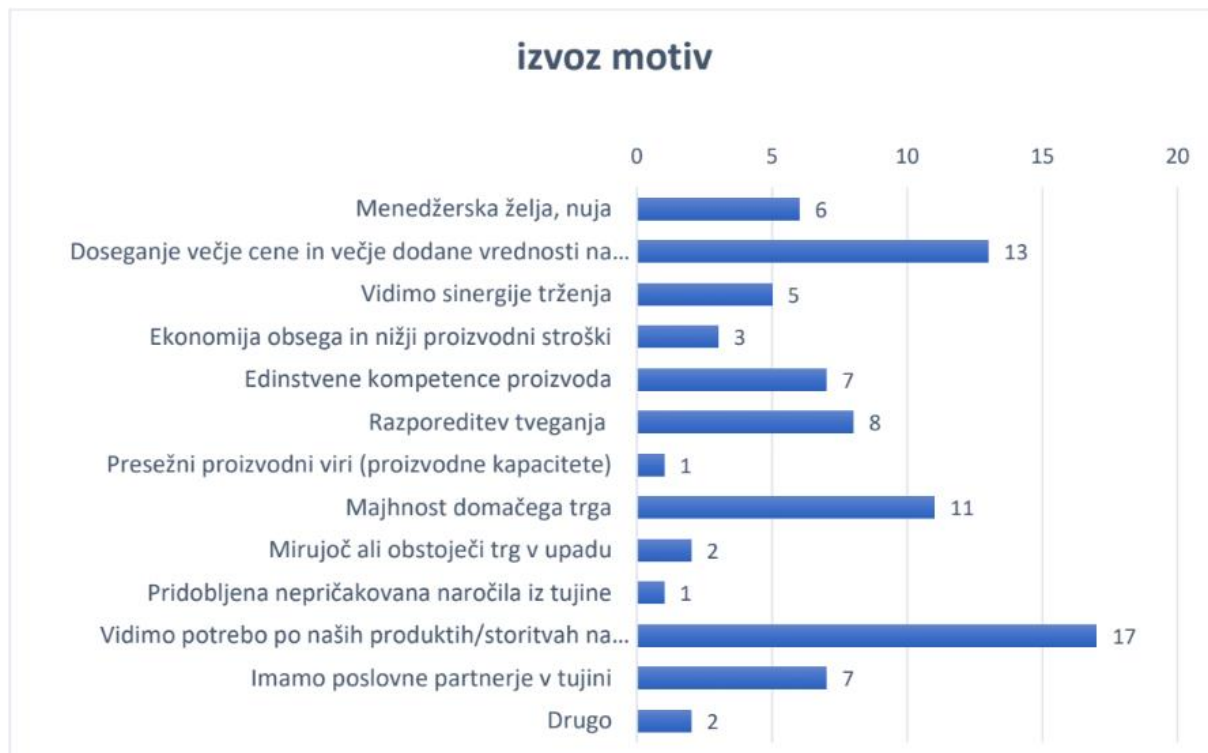
Slika: Analiza odgovorov na vprašanje 9 "Opredelite najpomembnejše MOTIVE za internacionalizacijo v podjetju"